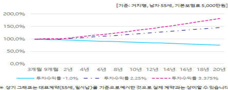
□ 경과기간별 해약환급금 예시그래프

※ 상기 그래프는 대표계약(남자55세, 일시납, 일시납보험료 5천만원, 종신)을 기준으로 표시한 것으로 실제 계약과는 상이할 수 있습니다.